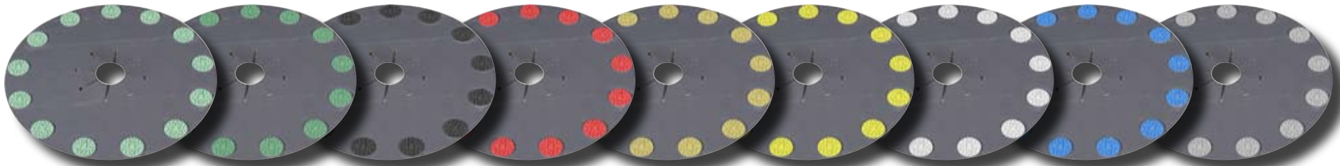
Semi-metal 30 grit

Level-S™ planchas de diamantes satelitales diamantan y pulen el concreto, mármol, piedra y azulejos rústicos.